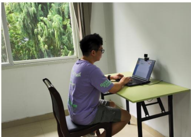
第二机位（环境摄像头）拍摄画面示意

第二机位应位于考生侧后方 45 度角左右位置，距离考生 1.2 米左右，确保能完全拍摄考生、考生桌面及第一机位；