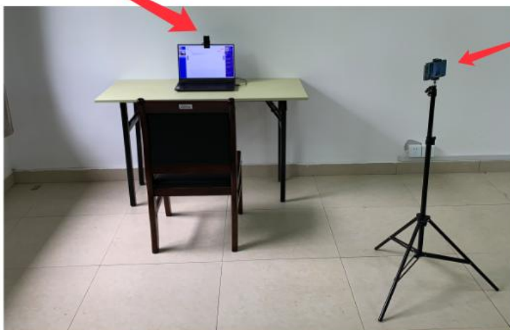
第一机位(人脸摄像头)